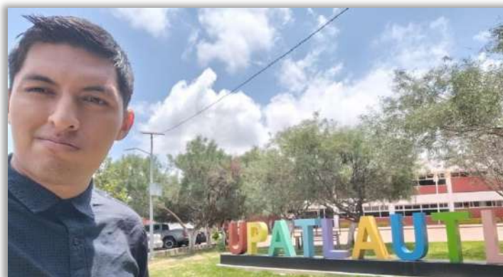
Por: C. Ángel Cortés Anzures.

Durante esta estancia trabajé en el desarrollo de UPAdemia, una plataforma de capacitación en línea que busca brindar acceso a contenidos educativos a estudiantes, docentes, personal administrativo y público en general. Este proyecto fortaleció mis habilidades tecnológicas y me permitió entender el valor de diseñar soluciones que impactan positivamente en la comunidad educativa.